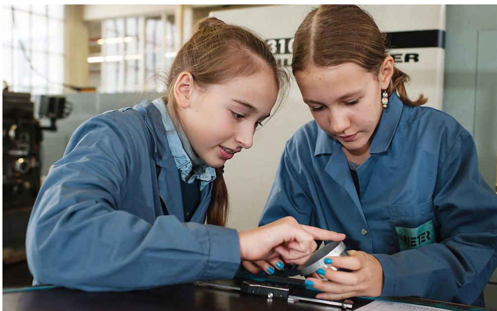
Due scolare controllano il pezzo che hanno appena fabbricato.